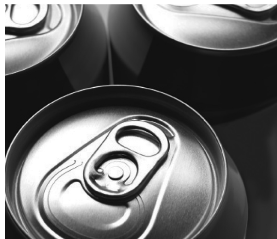
12oz Outside Scan Trial WithOVAndPrint Can #1 Outside